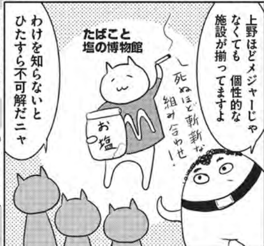
たばこと塩の博物館 www.jti.co.jp/Culture/museum/