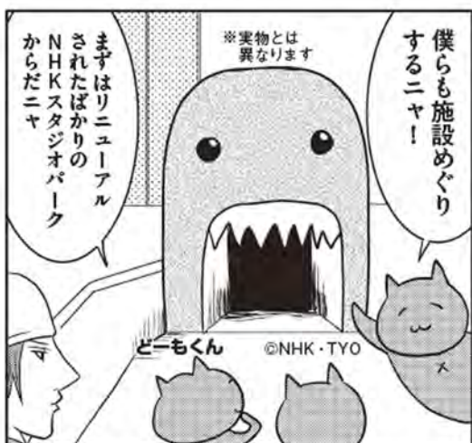
NHK スタジオパーク nhk.or.jp/studiopark/