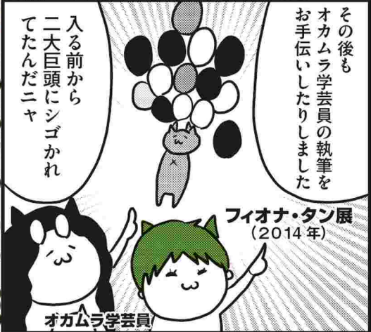
★若手の一人・ヤマミネ学芸員は卒業いたしました。