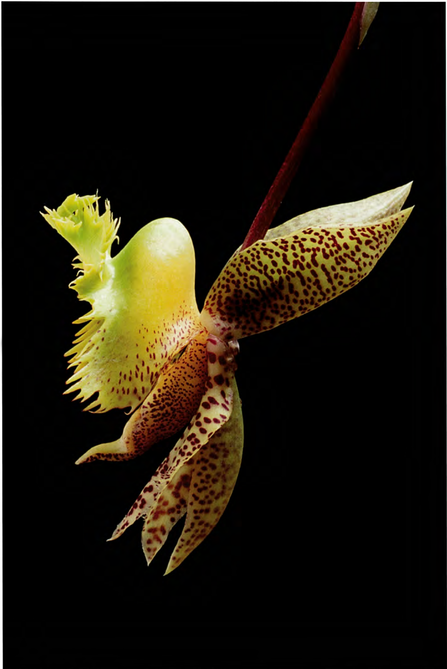
写真1 リカステ・コンセントレーション Lycaste Concentration