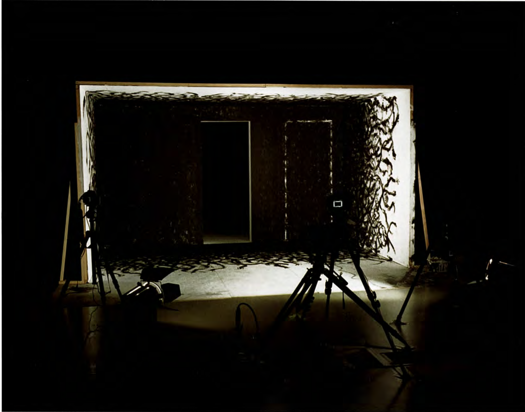
石田尚志《白い部屋》2012年：静止写真 ISHIDA Takashi, A White Room , 2012: Still photography