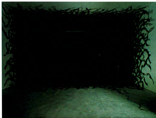
石田尚志《白い部屋》2012年：16ミリフィルム映像 ISHIDA Takashi, A White Room , 2012: 16mm film