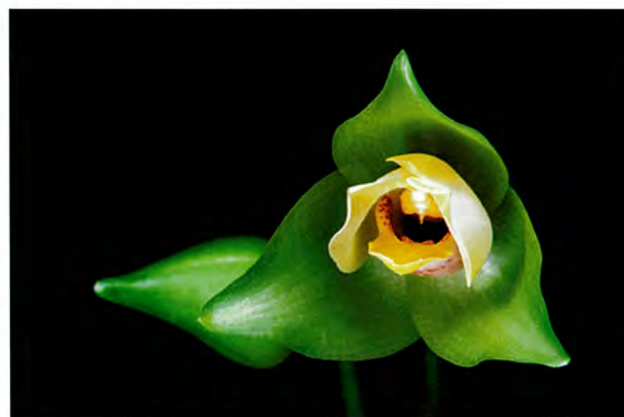
写真5 エリア・オルナタ・"ヴィー・オレンジ・ビューティ" Eria ornata 'Vi-Orange Beauty'