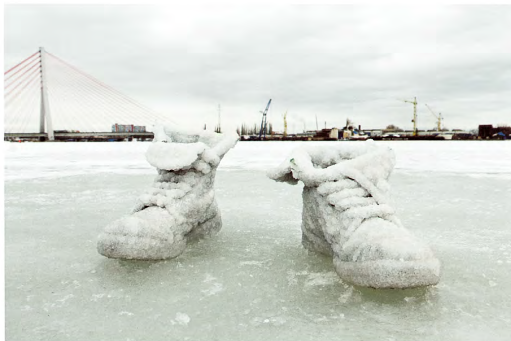
写真2 シガリット・ランダウ《Salted Lake》2011年(HDビデオ、11分4秒)