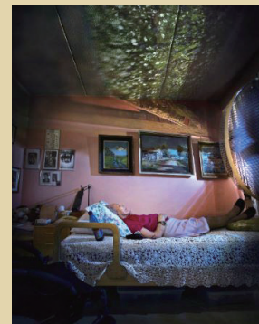
・「イメージと記憶（仮称）」 マルヤ・ピリラ《ルス》 〈インナー・ランドスケープ ストゥルク〉より 2011年