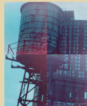
・「ホンマタカシ（仮称）」 ホンマタカシ《THE NARCISSISTIC CITY》 より2013年