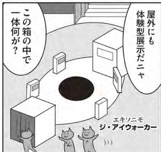
エクソニモ ジ・アイウォーカー エクソニモ公式サイト http://exonemo.com/