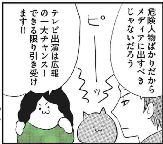
TOPのグルメ女王 普及係ビラサワ