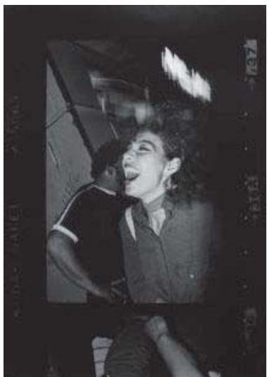
北島敬三 〈ニューヨーク〉より《#207》 1980 ゼラチン・シルバー・プリント