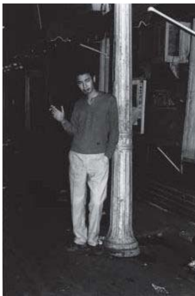
渡辺克巳 《新宿群盗伝66/73》より《歌舞伎町》 1971年 ゼラチン・シルバー・プリント