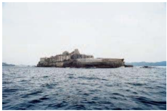
ニナ・フィッシャー&マロアン・エル・ザニ 《Sayonara Hashima》 2009年 その他のフィルム