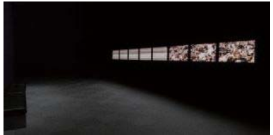
高谷史郎 〈Toposcan〉 2013年 その他のフィルム