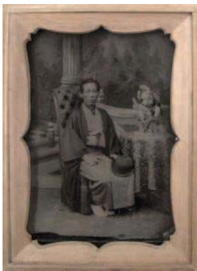
江崎禮二 《松村由章像》 1886年 アンプロタイプ