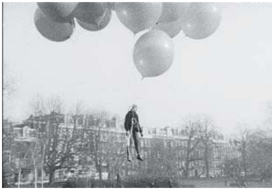
フィオナ・タン 《リフト》 2000年 その他のフィルム