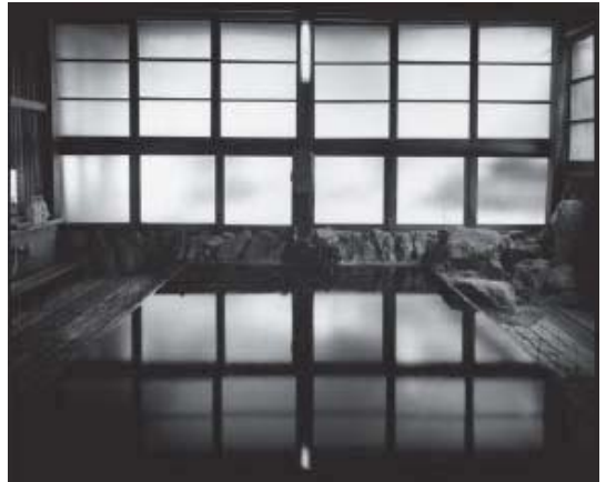
三好耕三 〈湯船〉より《湯峰 和歌山》 2010年 ゼラチン・シルバー・プリント