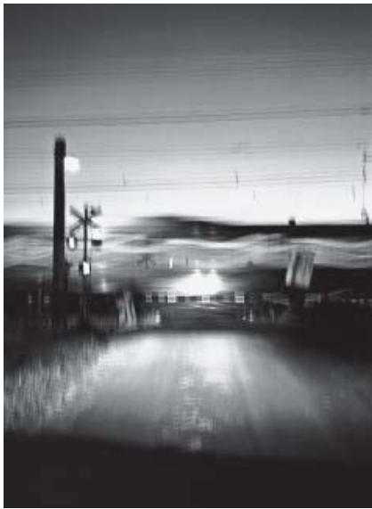
須田一政 〈廂の片〉 2012年 ゼラチン・シルバー・プリント