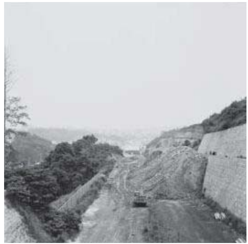
田村彰英 〈道〉より《1979年6月10日》 1979年 ゼラチン・シルバー・プリント