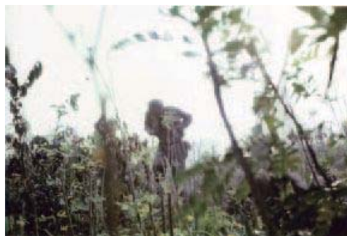
岡村昭彦 〈ピアフラ〉より 1968-1970 発色現像方式印画