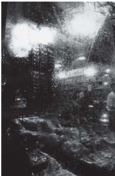
中平卓馬 《無題》 1968-69年 ゼラチン・シルバー・プリント