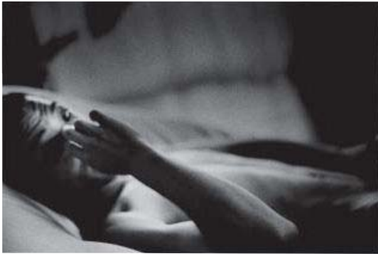
野村佐紀子 〈KUROYAMI〉 2008年 ゼラチン・シルバー・プリント