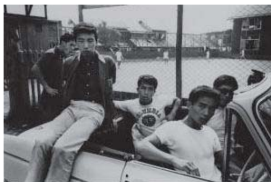
新倉孝雄 《セーフティ・ゾーン》より《旧軽井沢》 1964年 ゼラチン・シルバー・プリント