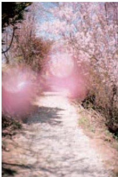
大森克己 〈すべては初めて起こる〉より《福島市、福島》 2011 発色現像方式印画