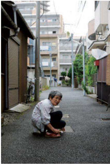
田代一倫 《2016年6月 豊島区北大塚》 2016年 発色現像方式印画