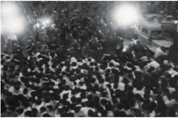
城之内元晴 《document 6・15》 1961年 16ミリフィルム