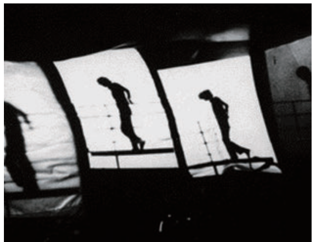
シュウゾウ・アツチ・ガリバー 《Cinematic Illumination》 1968～69年 インターメディア