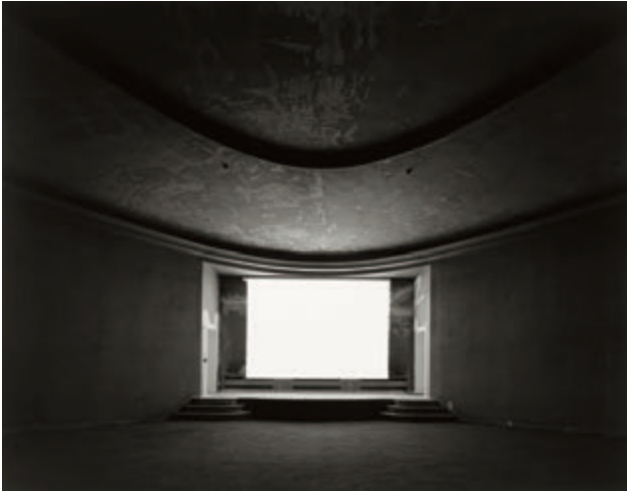
杉本博司〈廃墟劇場〉より 《ホール37、パレ・ド・トーキョー》 2013年 ゼラチン・シルバー・プリント