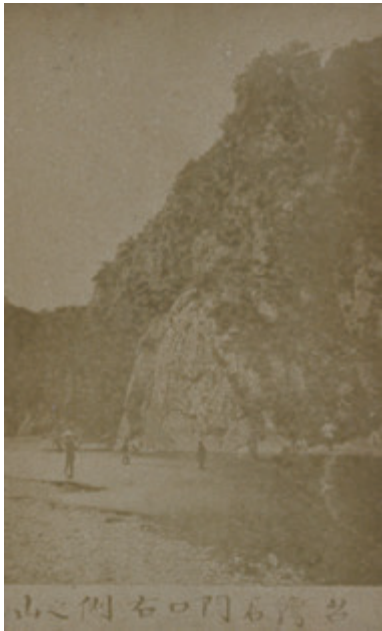
松崎晋二 〈台湾国之物〉より 《台湾石門口右側之山》 1874年 鶏卵紙