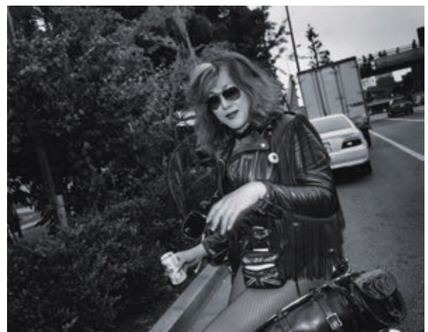
元田敏三 〈OPEN CITY〉より 2012年 ゼラチン・シルバー・プリント