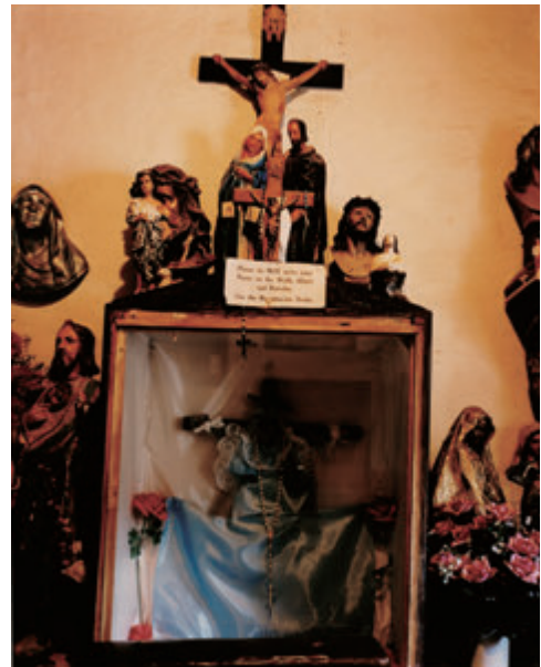
高橋恭司 〈ザ・マッド・ブルーム・オブ・ライフ〉より 《ニューメキシコ》 1991~93年 発色現像方式印画