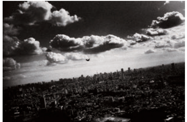
中藤毅彦 〈STREET RAMBLER〉より 2015年 インクジェット・プリント