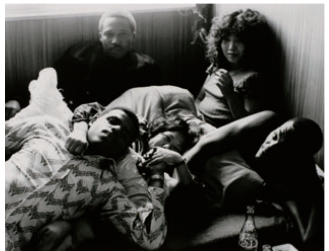
石川真生 〈熱き日々 in オキナワ〉より 1975~77年 ゼラチン・シルバー・プリント