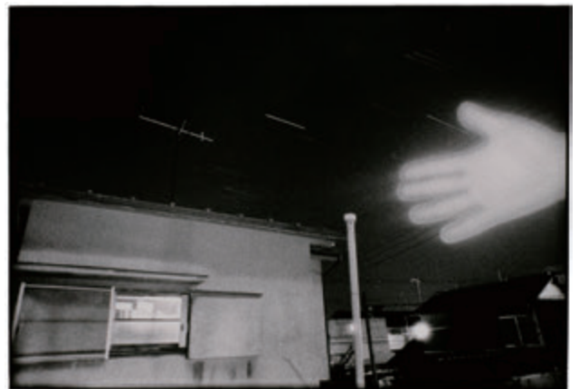
山崎博 〈OBSERVATION観測概念〉より 1974年 ゼラチン・シルバー・プリント