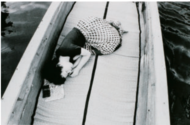
荒木経惟 〈センチメンタルな旅〉より 1971年 ゼラチン・シルバー・プリント