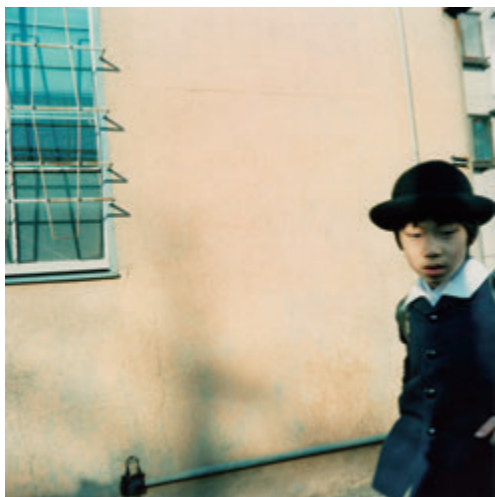
原美樹子 〈Is As It〉より 1996年 発色現像方式印画