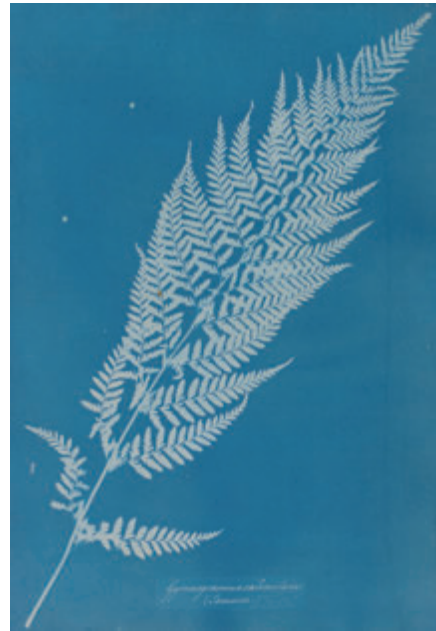
Anna Atkins 《ギンダ (ジャマイカ)》 1851~54年頃 サイアノタイプ