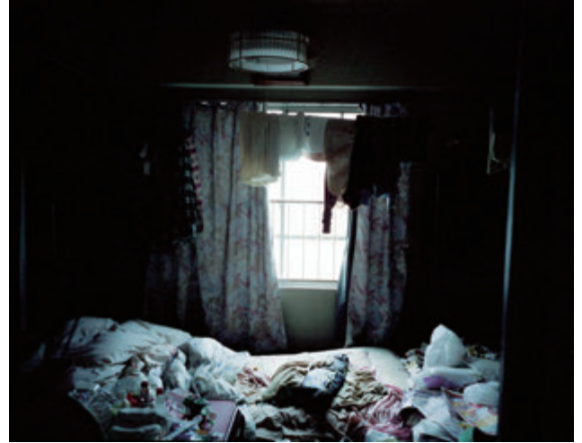
郡山総一郎 〈Apartments in Tokyo〉より 2013~14年 発色現像方式印画