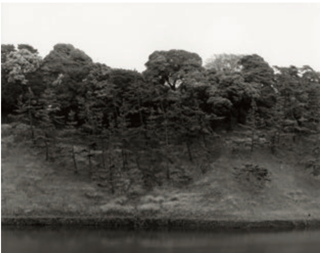
山本糾 〈Jardin〉より 《Jardin 9》 2002年 ゼラチン・シルバー・プリント