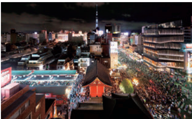
佐藤信太郎 〈東京|天空樹〉より 《2016年5月15日 台東区浅草》 2013年 インクジェット・プリント