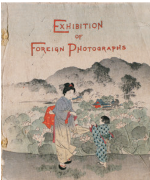
William Kinninmond Burton 『外国写真展覧会 目録』 1893年 その他の技法