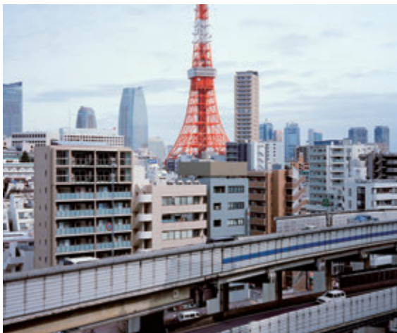
小島康敬 《Tokyo》 2013年 インクジェット・プリント