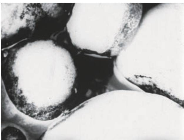
出光真子 《At Yukigaya 2》 1974年 16ミリフィルム