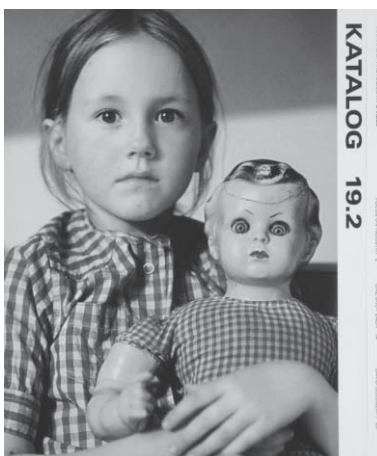
図26 KATALOG 19.2, 2007

トキン (Joel-Peter Witkin) に大きな影響を与えたとされるアメリカの写真家ジェフリー・シルヴァーソーン (Jeffrey Silverthorne) の個展 (Directions for Leaving: Photographs 1971-2006) (図24) やオノ・ヨーコ展 (Yoko Ono Conceptual Photography 1997) があるほか、昨年開催された川内倫子展など日本への関心度も高い。