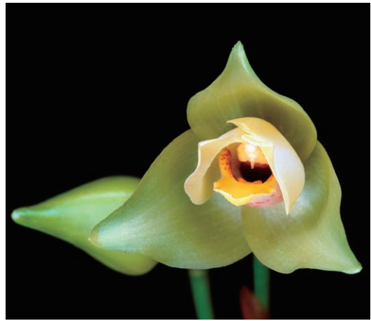
福原義春 「蘭の顔」展 (2007年) より