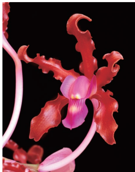
福原義春 「蘭の顔」展 (2007年) より