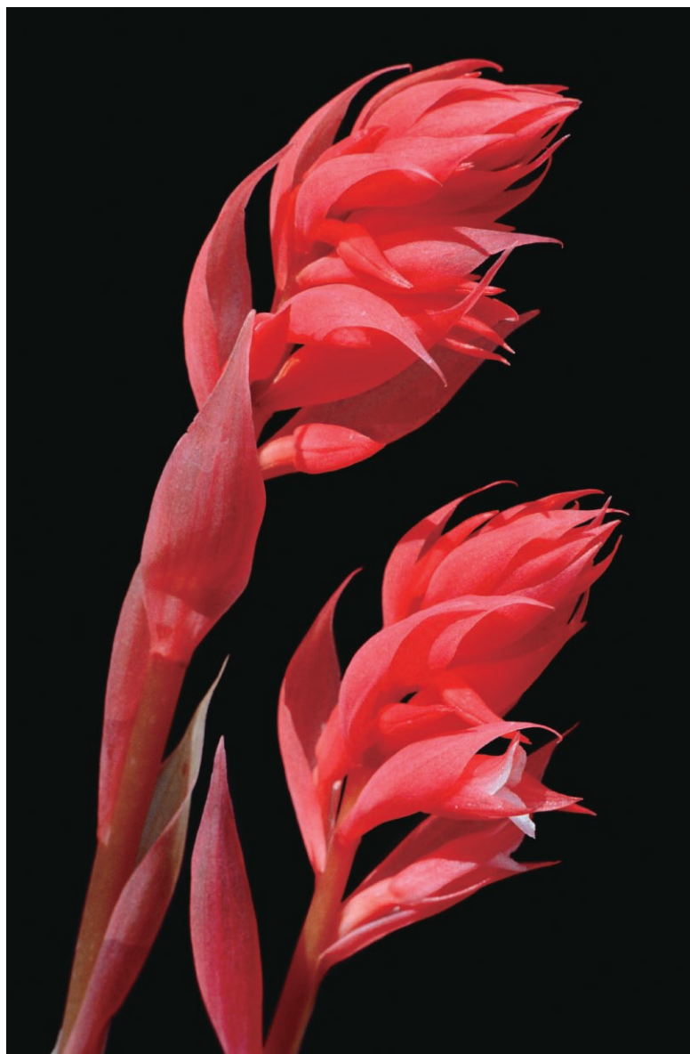
福原義春 「蘭の顔」展（2007年）より