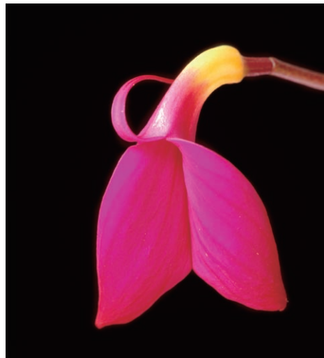
福原義春 「蘭の顔」展 (2007年) より