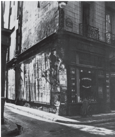
Jindřich Štyrský, from the series, Photography , 1934-35, Museum of Decorative Arts, Prague

チェコにおけるシュルレアリスムの開幕が示されたのは、1934年に発表されたネズヴァル草案による宣言文、「チェコにおけるシュルレアリスム」によってであった。これにシュティルスキー、トワイヤン、詩人のコンスタンティン・ビーブル (K. Biebl)、ホンズルらが署名した。