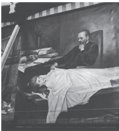
Jindřich Štyrský, from the series, Frog Man , 1934, Museum of Decorative Arts, Prague

塞期を迎えてゆく。そしてシュルレアリスムに関係する出版物検閲が強化され、その刊行が違法とされるようになる。このような状況下で41年に出版されたのが、後述するシュティルスキーとトワイヤン、ハイスラーによる『Z kasement spanku (From the Casement of Sleep)』『Ne jehlach techto ani (On the Needles of These Days)』であった。そしてその後登場するのが、ヤロミール・フンケ (Jaromír Funke) やエミラ・メトコヴァー (Emila Medková) である。彼らは、戦後のチェコにおけるシュルレアリスムの写真表現において最も注目すべき作家たちである。