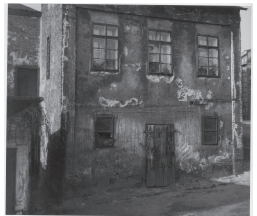
Jindřich Štyrský, from the series, Photography , 1934-35, Museum of Decorative Arts, Prague