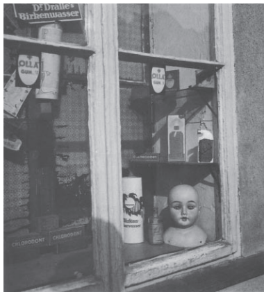
Jindřich Štyrský, Untitled , c. 1934, Museum of Decorative Arts, Prague