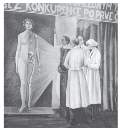
Jindřich Štyrský, from the series, Frog Man , 1934, Museum of Decorative Arts, Prague