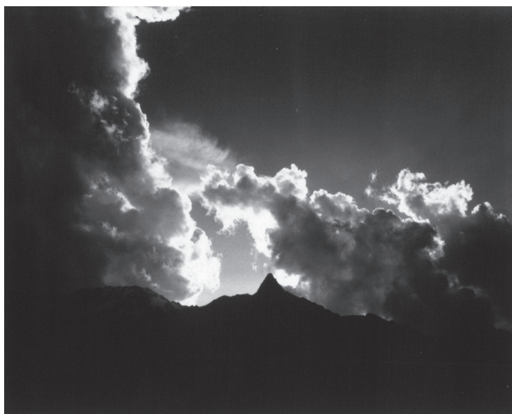
図2 槍ヶ岳の稜線に雲がわき、遙か上空までのぼっていく

貞雄であったが、兵役は免除されず、幹部候補生に採用された。激しい訓練が行われ、夜間演習にも参加し、遠近感がさらに落ちる夜間は足下がおぼつかなくなる。演習時、いつもそばにいて目が不自由な貞雄の手を引いてくれた戦友がいた。その戦友の名は、 あしべのぶ 喜 よし (1923-1999)。日本を代表する法学者で、東京帝国大学法学部時代に学徒動員され、戦後は母校で教鞭をとり、文化功労者となった人物である。