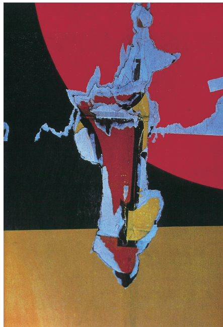
図 6 エルンスト・ハース《ポスター》 1960年、「エルンスト・ハース作品集」より 『カメラ毎日』1962年8月号、23頁