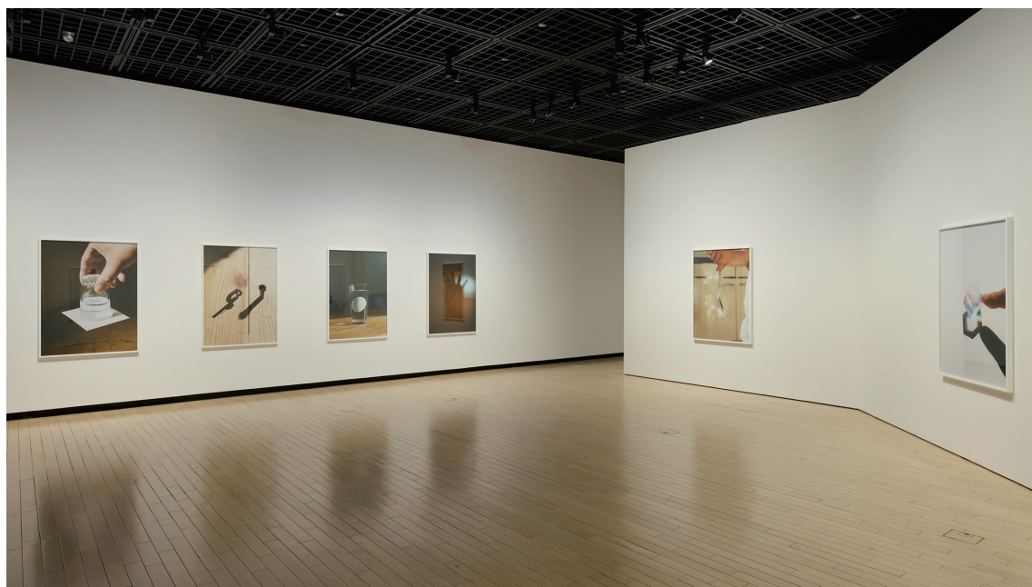
図1 (上) ジョアン・ミロ《コンポジション》(1924年、DIC川村記念美術館蔵)と野口里佳作品の展示風景 「ふたつのまどかーコレクション×5人の作家たち」展 (DIC川村記念美術館、2020年) 展示風景