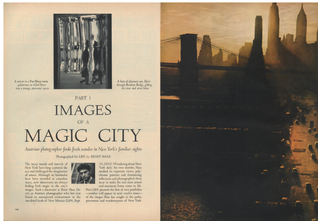
図 5 「Part 1 Images of a Magic City」より 『ライフ』1953年9月14日号、108-109頁