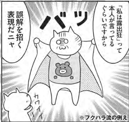
※フクハラ流の例え