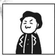
ヒジイタトソゾー